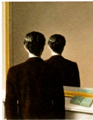
← René Magritte, 'La reproduction interdite', 1937, olieverf op doek, 81 x 65 cm